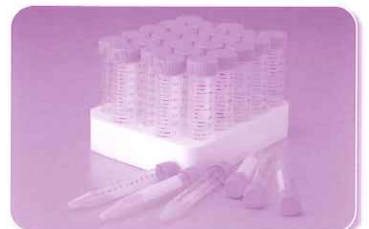
遠沈管(印刷目盛付)