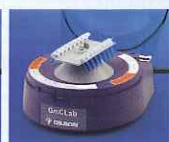
PCRチューブ用ローター (F1077304)