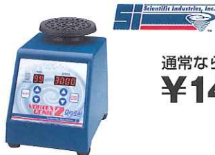
Digital Vortex-Genie® 2