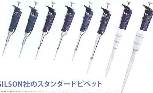
GILSON社のスタンダードピペット