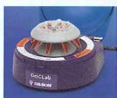
マイクロチューブ用ローター (F1077303)

本体/マイクロチューブ用ローター/ PCRチューブ用ローター/ 1.5mLマイクロチューブ×8本/ 8-PCR(0.2mL)チューブ×2ストリップ