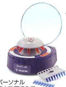
パーソナル 卓上微量遠心機 GmCLab