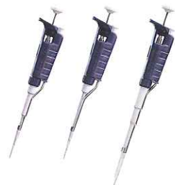
P-20 P-200 P-1000