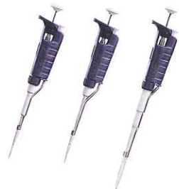
P-20 P-200 P-1000