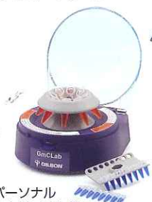
パーソナル 卓上微量遠心機 GmCLab