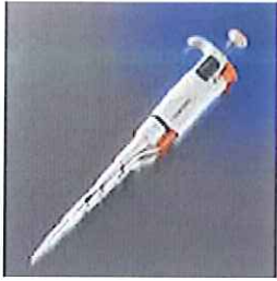
シングルチャンネルピペッター