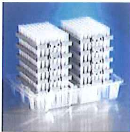
4130の詰め替えチップ10デック 入り