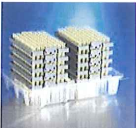
4132の詰め替えチップ10デック 入り

※デックワーク™スターターキットは期間中メーカー希望小売価格の半額で販売しております。詳しくはキャンペーンチラシをご覧ください。