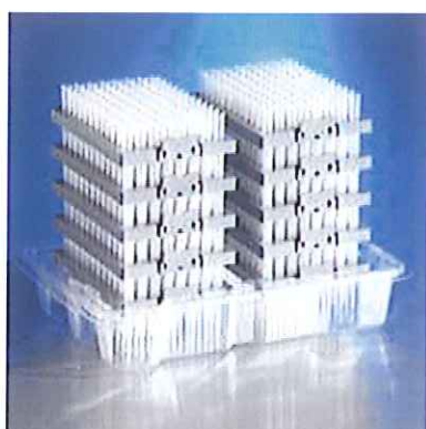
4133の詰め替えチップ 10デック入り

*2010年12月24日弊社出荷分まで。年末はキャンペーン受注が殺到することが予想されます。お早めにご注文をお願いします。