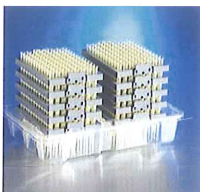
4132の詰め替えチップ10デック入り