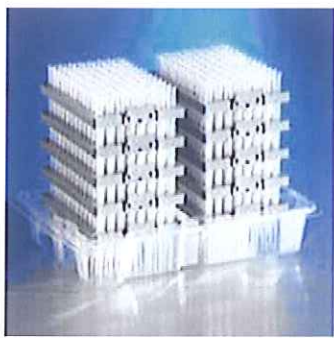
詰め替えチップ 8個または10個の詰め 替え用デックが中身の見える透明なトレイ に入ってフィルムでラップされています。

発売を記念して空のヒンジラックと詰め替えチップがセットになった スターターキットを期間限定で50%OFFにてご提供いたします。